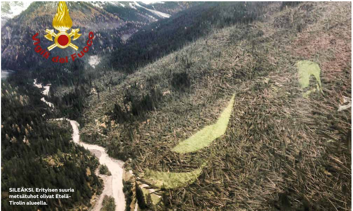
SILJÄKSI. Erityisen suuria metsätuhot olivat Etelä-Tirolin alueella.