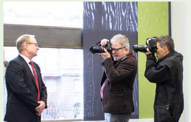
VASTAVALITTU. Uusi puheenjohtaja pian valinnan jälkeen lehdistön haastateltavana ja kuvattavana.