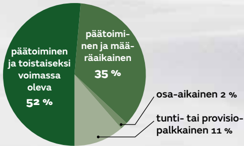
Taulukko 2. Työsuhteen laatu