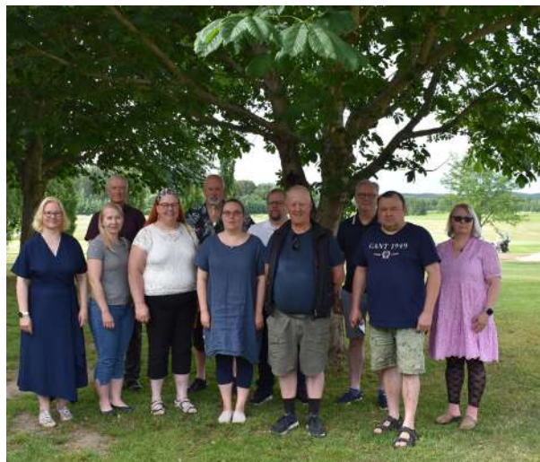
Agrologien Liiton hallitus ja edustajiston puheenjohtajisto kesätunnelmissa Lepaalla.